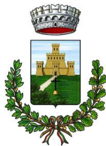
Comune di Lizzano in Belvedere